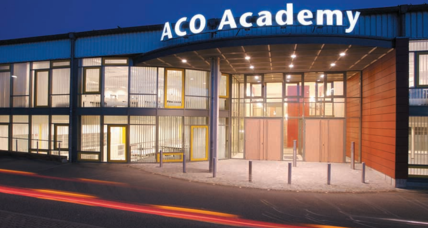
Oben: Die ACO Academy vermittelt kompaktes Know-how rund um Oberflächen- und Gebäudeentwässerung oder Wohnungsbau Unten: Die Hallen der Eisengießerei auf dem Kunstwerk Carlshütte Gelände dienen als außergewöhnliche Ausstellungsorte