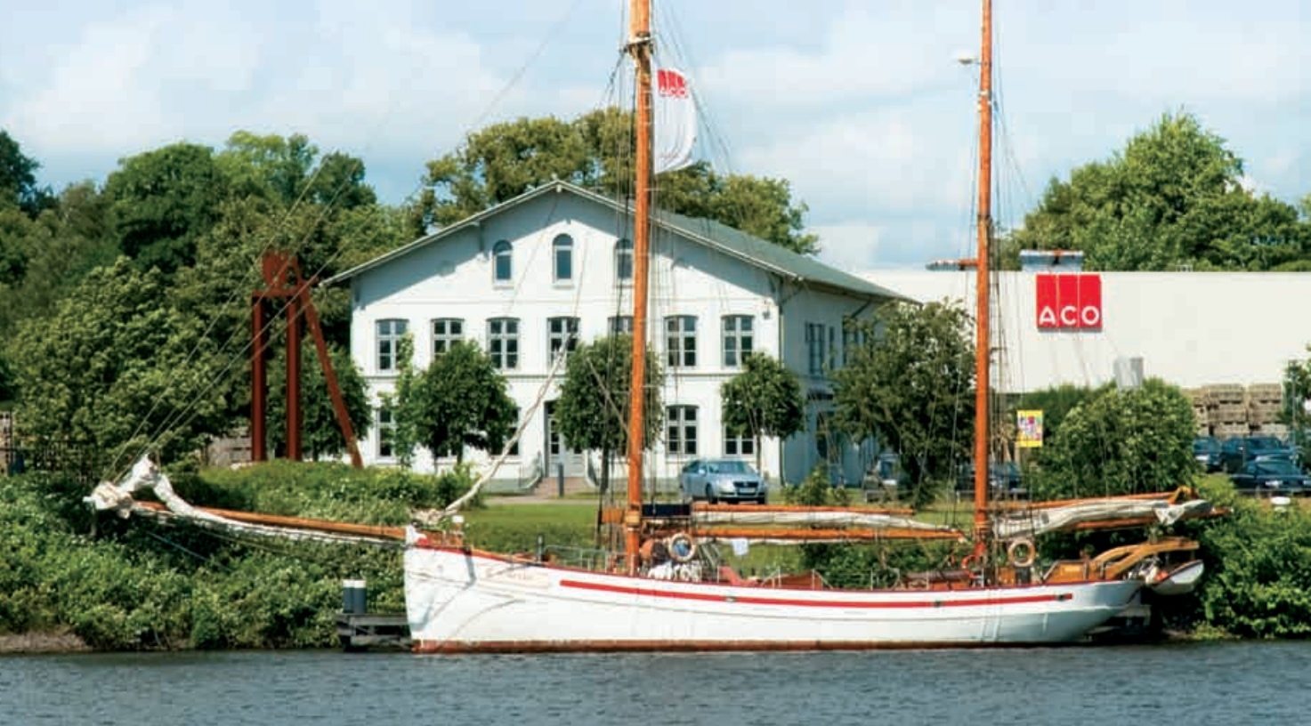
Oben: Hauptsitz der ACO Gruppe – die historische Pferdehaltereier am Ufer der Eider Unten: Skulpturenausstellung NordArt